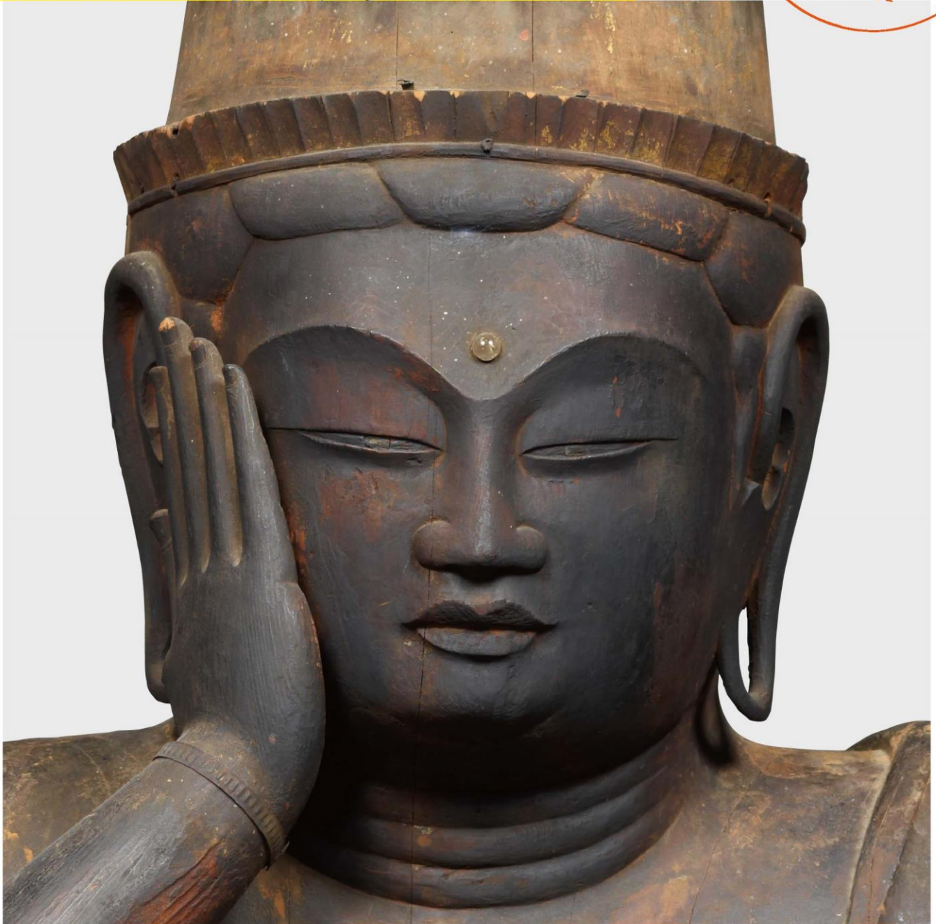
（如意輪観音菩薩坐像）部分、木造、古色（現状）、平安時代、9〜10世紀、重要文化財、奈良国立博物館蔵