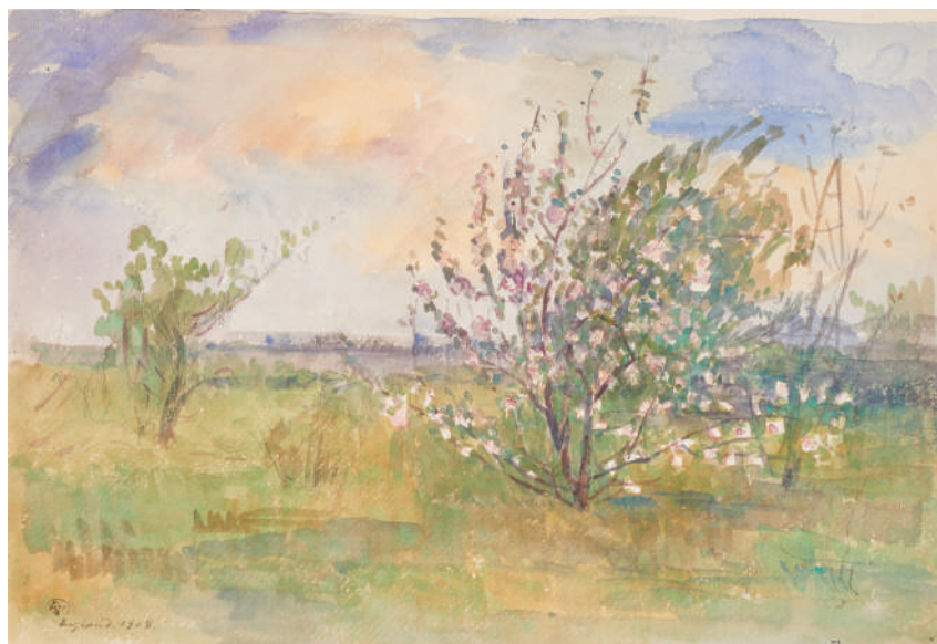
南薫造《イングランド》1908年、水彩・紙

本展では、当館が所蔵する風景にまつわる油彩画や水彩画、日本画、版画、そして写真作品を紹介します。作者たちは、なぜその風景を描き、あるいは写し留めようとしたのでしょうか。さまざまな風景を巡り、その土地や作者たちのまなざしに思いを馳せてみてください。