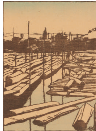
石井柏亭《木場》1914年、木版・紙