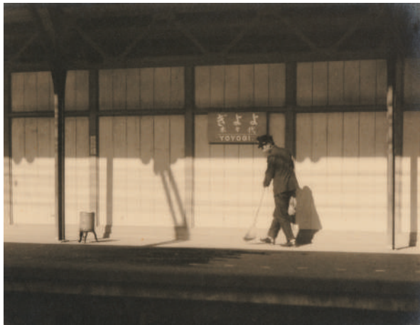
石田喜一郎《清掃》1925年、ゼラチンシルバークラウド