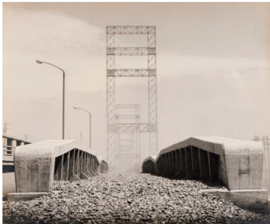
村林忠《埋地風景2》1961年、ゼラチンシルバークラウド