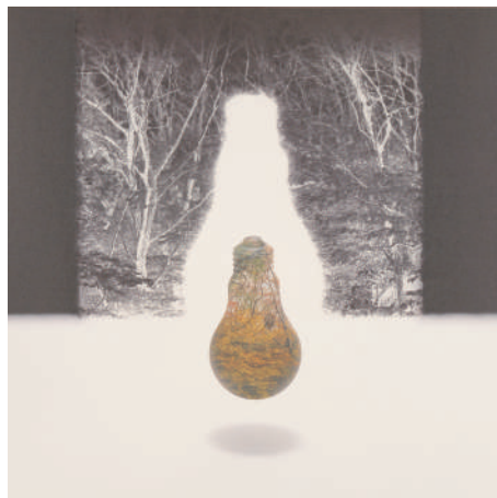
遠藤亨《SPACE&SPACE/LIGHT BULB 6》1989年、オフセットリトグラフ・紙