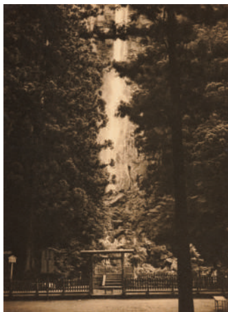
掛札功《第二十一 那智瀧（直下四十三丈）》1989年、オフセットリトグラフ・紙