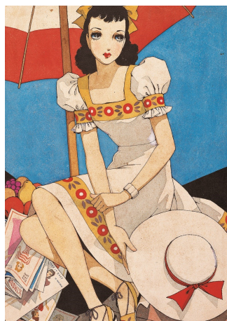
④中原淳一 《扉絵原画（『きものノ絵本』）》 1940年 個人蔵