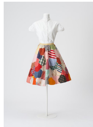
左：⑥中原淳一《扉絵原画（『中原淳一ブラウス集』）》1955年 個人蔵