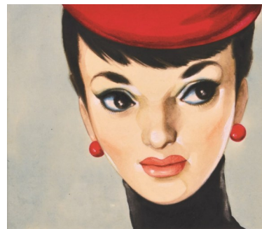
⑤中原淳一 《表紙原画（『それいゆ』第31号）》 1954年 個人蔵