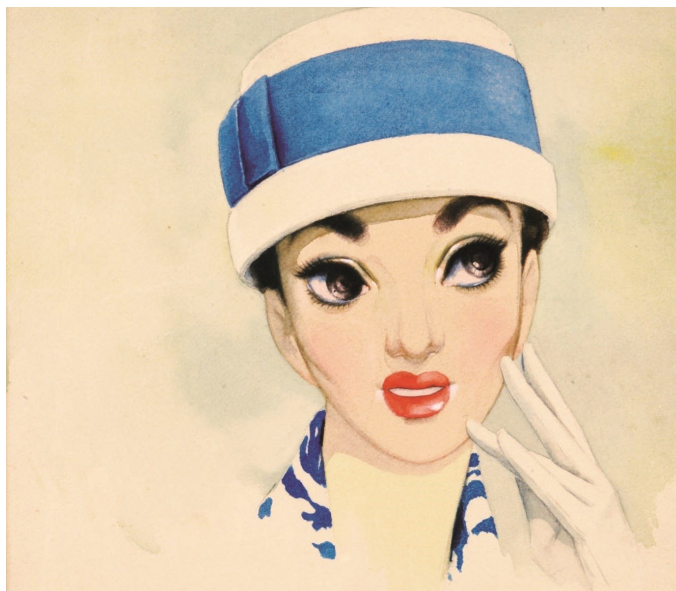
①中原淳一《表紙原画(『それいゆ』第39号)》1956年 個人蔵 ©JUNICHI NAKAHARA / HIMAWARIYA

展覧会の会期・開館時間・イベント等が変更・中止となる場合がございます。最新情報は当館HPまたはSNS等でご確認いただきますようお願いいたします。