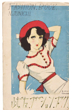
②左：中原淳一《『少女の友』第33巻第12号》1939年 個人蔵