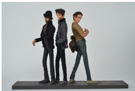
⑪中原淳一《三人のスリ》1962年 個人蔵