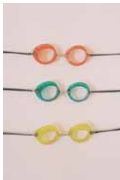
デザイン：有山達也