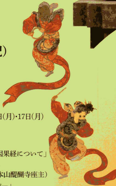
◎舞楽図屏風(左隻部分) 依屋宗達筆

世界最古の絵巻 国宝 過去現在絵因果経 十五メートル三十六センチ全場面 期間限定! いっきに初めて公開します!! 全場面展示 / 10月7~13日、10月28~11月3日、11月18~24日 前半場面展示 / 10月15~26日 後半場面展示 / 11月5~16日