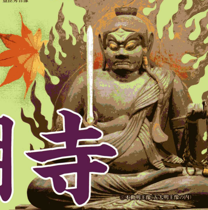
不動明王像(五大明王像の内)