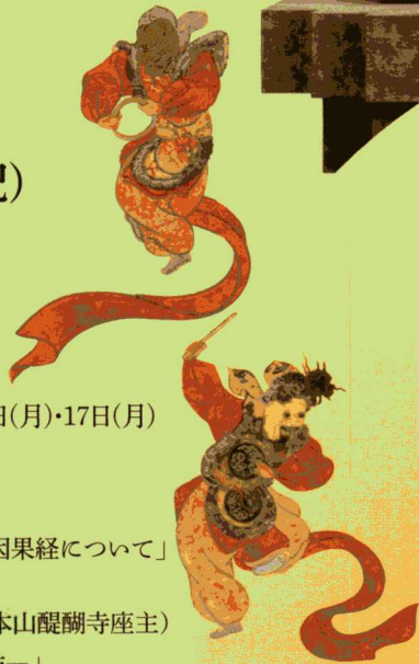
◎舞楽図屏風(左隻部分) 依屋宗達筆

世界最古の絵巻 国宝 過去現在絵因果経 十五メートル三十六センチ全場面 期間限定! いっしょに初めて公開します!! 全場面展示 / 10月7~13日、10月28~11月3日、11月18~24日 前半場面展示 / 10月15~26日 後半場面展示 / 11月5~16日