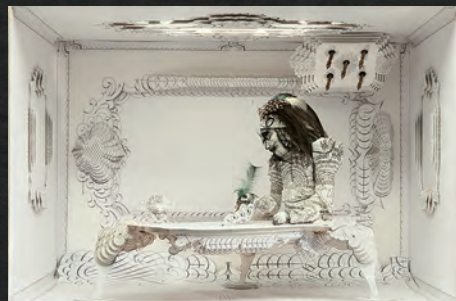
デコール(BBC2のアイドント) 1991年