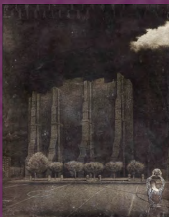
《楡の木の向こうからトランペットの音が》1970年代 courtesy Tommy Simoens, Antwerp

この後、1969年に英国に渡り、ロンドンのロイヤル・カレッジ・オブ・アートに進学。カフカの文学やヤナーチェク*1の音楽、ヤン・シュヴァンクマイエル*2の映像作品など、東欧文化の色濃い影響を受けつつ、短編アニメ映画制作などにその才能を開花させていきます。現在、クエイ兄弟はロンドンを拠点に、アニメ、映画制作、CM、舞台美術など幅広い分野で活躍し、日本でもカルト的な人気を誇っています。本展は、クエイ兄弟の初期のイラストレーションから、アニメーション制作の舞台装置の精緻なデコール、これまで日本で紹介される機会の少なかった映像作品や舞台美術の仕事、影響を受けたポーランドのポスター作品など、その独自の美の世界の全体像にせまるアジア初の本格的な回顧展です。