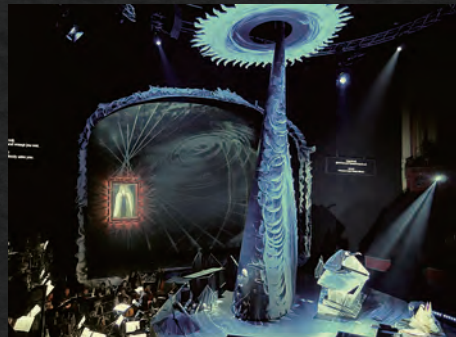
『世界の劇場』王立カレ劇場・アムステルダム 2016年