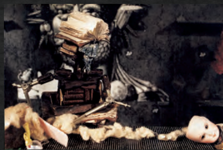
『ヤン・シュヴァンクマイエルの部屋』1984年 16mm カラー

*1 チェコの作曲家、近年は村上文学にも登場 *2 チェコの人形アニメーション作家