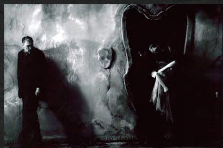
『ペンヤメンタ学院、または人々が人生と呼ぶこの夢』 1995年 35mm モノクロ(参考作品)