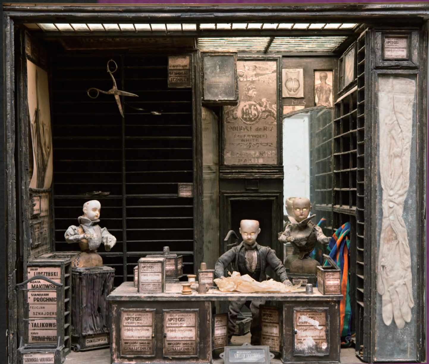
クエイ兄弟『ストリート・オブ・クロコダイル』よりデコール《仕立屋の店内》1986年

THE SHOTO MUSEUM OF ART June 6 - July 23, 2017