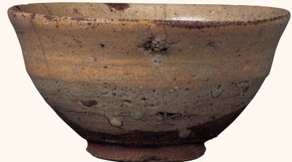
《唐津 茶碗 銘「三宝」》桃山時代 重要文化財