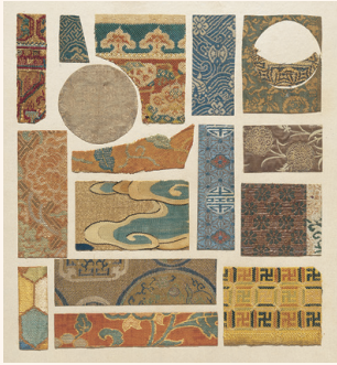
《名物裂集古鑑》(部分) 江戸時代