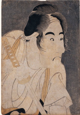
東洲斎写楽《二世坂東三津五郎の石井源蔵》江戸時代 後期展示