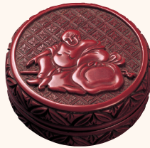
《堆朱 布袋図香合》明時代