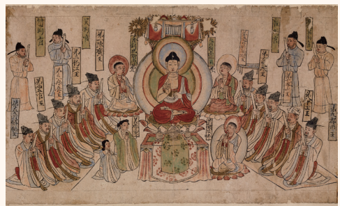
《十王経図巻》(部分) 五代～北宋時代 重要文化財 前期展示