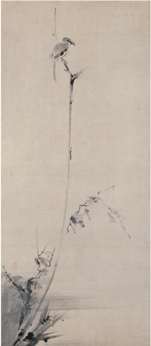
宮本武蔵《枯木鳴鶉図》江戸時代 重要文化財 前期展示