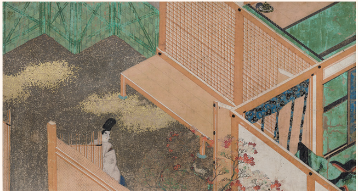
《伊勢物語絵巻》(部分) 鎌倉時代 重要文化財 前期展示