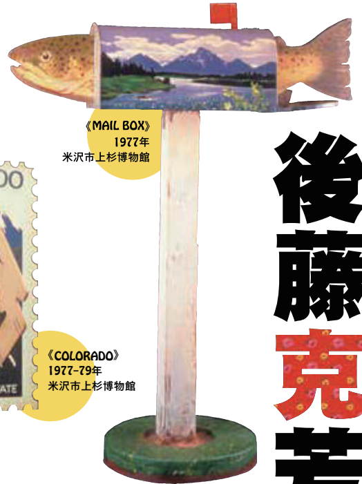
《MAIL BOX》 1977年 米沢市上杉博物館