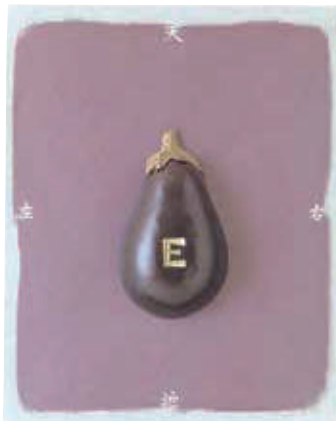
《E》 1991年 個人