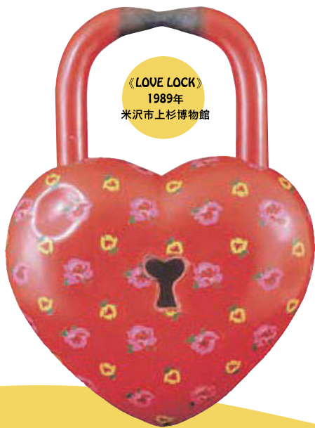
《LOVE LOCK》 1989年 米沢市上杉博物館

後 藤克芳(1936~2000)は、ニューヨークを舞台に、現代美術の新しい流れと なったポップアートに取り組み、活躍した作家です。主に木を用い、スーパ リアリズムの手法で、驚くべき完成度の高さをみる半立体作品を制作しました。 自然豊かな山形県米沢市に生まれ、少年期から絵の道を目指し、やがて武蔵野美術 学校西洋画科に入学し、そこで知り合った荒川修作や篠原有司男などと交流を深め、 故郷で彼らを招いてネオ・ダダを紹介するなど、活発に活動しました。 1964年に渡米しニューヨークに居を定め、1972年には永住権を獲得、2000年に 同地で病没するまで、商業デザインなどで生計をたてなが ら、一流のギャラリーで勝負をしよう制作活動を続け、 さらにはニューヨークの文化や暮らしを「ニューヨークだ より」として晩年まで日本へ紹介し続けました。ニューヨ ークの様々な芸術家たちと交流をもち、その刺激を大いに受 けた後藤の作品群は、没後、遺族により故郷の米沢市上 杉博物館へと帰ってきました。後藤が発信する文章や、 ポップでキッチュな作風とは裏腹に、非常に几帳面な 仕上がりを見せる作品は、見る人を惹きつけてやみませ ん。「日常がアートになる」と、身近な題材を“アート”に 昇華させた後藤の作品を紹介します。