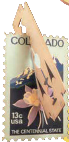
《COLORADO》 1977-79年 米沢市上杉博物館