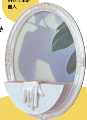
《untitled(銀の手袋)》 制作年未詳 個人