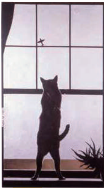
《WINDOW》 1997年 米沢市上杉博物館 (後期展示)